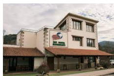
Zubiri – Hosteria de Gautxori https://hostalgautxori.com