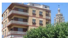
Los Arcos – Hotel Monaco http://www.hotelmonaco.es