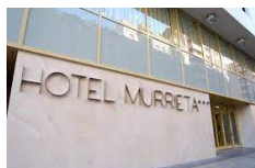
Logroño – Hotel Murrieta https://hotel-murrietalogrono.com