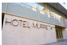
Logroño – Hotel Murrieta https://hotel-murrietalogrono.com