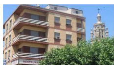
Los Arcos – Hotel Monaco http://www.hotelmonaco.es