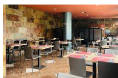
Estella – Hotel Yerri http://www.hotelyerri.es