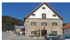
Roncesvalles – Posada de Roncesvalles https://laposada.roncesvalles.es

Una selezione di sistemazioni diverse, che vanno dai tradizionali hotel di paese, pensioni rurali, gli affascinanti e confortevoli hotel rurali, in camere con bagno privato.