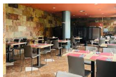
Estella – Hotel Yerri http://www.hotelyerri.es