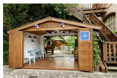
Puente la reina – Hotel Jakue https://www.jakue.com