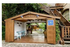
Puente la reina – Hotel Jakue https://www.jakue.com