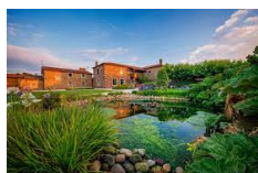
Pazo de Santa Maria - Arzua www.pazosantamaria.com