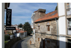
Hotel Ada Bonaval - Santiago de Compostela https://aldahotels.es/alojamientos/hotel-alda-bonaval-santiago/