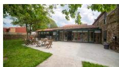
Casa Do Acivro - O Pino https://oacivro.com/?lang=en