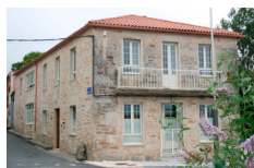
Casa Leopoldo - Palas de Reis https://casaleopoldocaminodesantiago.com/