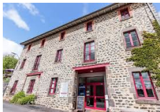
Gite La Cabourne - S'-Privat d'Adllier http://www.lacabourne.fr/