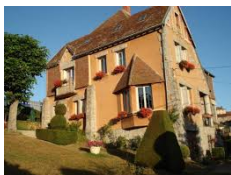
Les Gabales - Saugues https://www.lesgabales.com/