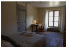
Chd Epicurum - Puy en Velay