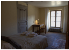
Chd Epicurum - Puy en Velay