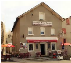
Cdh Saint Jacques - St Alban sur Limagnole http://www.auberge-saint-jacques.fr/