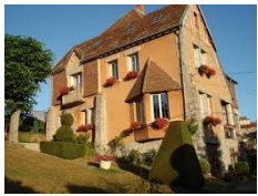
Les Gabales - Saugues https://www.lesgabales.com/