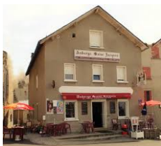
Cdh Saint Jacques - St Alban sur Limagnole http://www.auberge-saint-jacques.fr/