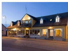
Hotell Köpmansgården, Hoganas https://www.kopmansgarden.se/