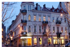
Hotel Linnea, Hoganas http://www.hotell-linnea.se/