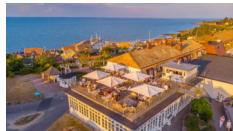
Rusthållaregården, Arild http://www.rusthallargarden.se/