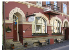
Hotel Lilton, Angelholm http://www.hotel-lilton.se/

Il prezzo include sistemazione in camera doppia / twin condivisa in boutique hotels e b&b, in camera con bagno privato.