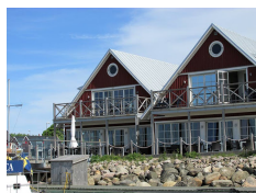
Bryggan Hotell, Hoganas http://www.hoganasbrygga.se/