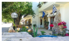
Hotel Neos Omalos - Omalos www.neos-omalos.gr