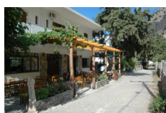
B&B Pachnes Pension - Agia Roumeli www.pachnes.gr