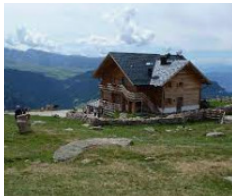
Rifugio Resciesa - Ortisei https://www.rifugioresciesa.com/it/