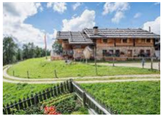
Rifugio Kreuzwieser Alm - Lusen https://www.kreuzwiesenalm.com/it/