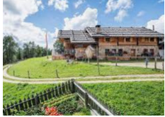
Rifugio Kreuzwieser Alm - Lusen https://www.kreuzwiesenalm.com/it/