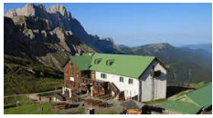
Rifugio Genova - Funes http://www.schlueterhuetten.com