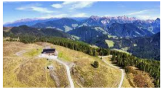
Rifugio Monte Muro - San Martino in Badia https://www.maurerberg.com/