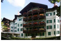
Residence Gasser - Bressanone https://www.gruenerbaum.it

In questo viaggio non è previsto il trasporto bagaglio .