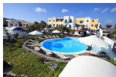
Kalimera Hotel - Santorini www.kalimerasantorini.com