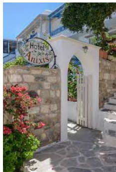
Hotel Anixis - Naxos https://www.hotelanixis.gr/index.php?lang=en

7 pernottamenti in Pernottamento e Prima Colazione (3 notti di Naxos, 4 notti a Santorini)