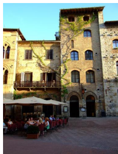
Hotel La Cisterna - San Gimignano https://www.hotelcisterna.it