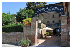
Hotel Borgo Antico - Lucignano

L'albergo si trova nel centro delle Crete Senesi, immerso in un'atmosfera tranquilla e piacevole. Le camere piccole, ma pulite, sono curate in tutti i minimi particolari mantenendo lo stile tipico Toscano con travi e rifiniture in legno e da alcune è possibile ammirare il paesaggio toscano. Offrono WiFi gratuita, aria condizionata, TV.