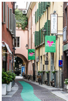
Hotel Torino - Parma www.hotel-torino.it