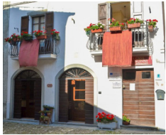
B&B La Casa dei Nonni - Berceto www.lacasadeinonni berceto.it