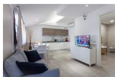
Bed&Bike - Aulla https://bedebike.it