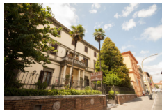
Hotel Chiusarelli - Siena www.chiusarelli.com

Pernottamenti in camera doppia in hotels **/***, B&B e agriturismi con prima colazione