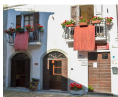
B&B La Casa dei Nonni - Berceto www.lacasadeinonniberceto.it