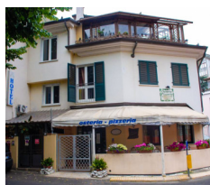
Hotel Annunziata - Massa www.hotelannunziata.com